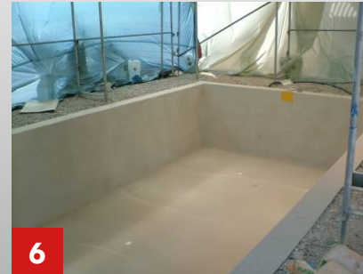
6 Beckeninnenflächen komplett grundiert und besandet.