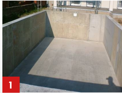
1 Beckenkörper aus Stahlbeton nach dem Ausschalen.