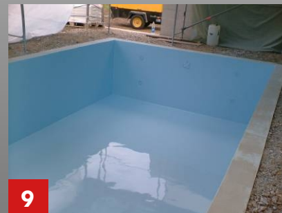
9 Fertige Beckenbeschichtung.