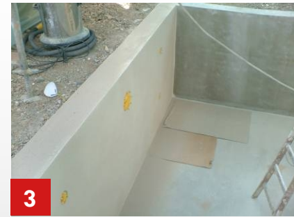
3 Einbauteile abgeklebt, Fläche gereinigt.