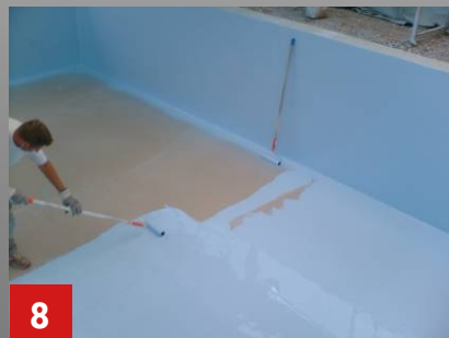
8 Beschichtung des Bodens. Material vergossen und verteilt.