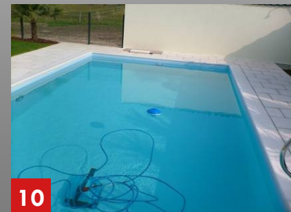
10 Becken mit Randgestaltung in Betrieb.