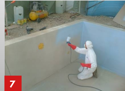
7 Beschichtung der Wände im Spritzverfahren.