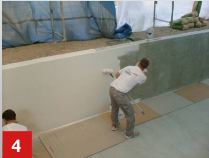
4 Grundierung der Wände im Walzverfahren.